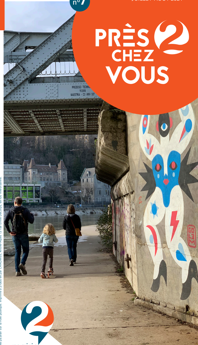
Ne pas jeter sur la voie publique. Imprimé à 21000 ex par CHAUMEIL Rhône-Alpes 13 rue Emile Decoms 69100 Villeurbanne.