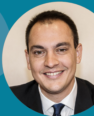
Pierre OLIVER Maire du 2 e arrondissement