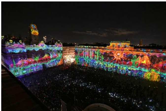
Projections lumineuses grand format sur la Place des Terreaux.