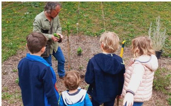
Sensibilisation aux cycles de la nature avec un groupe de scolaires