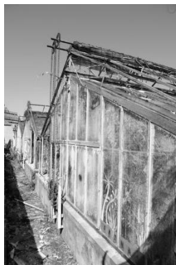
Photos de la partie fermée au public des Petites Serres dans son état actuel

Au sein du Parc de la Tête d'Or , plus grand parc urbain d'Europe, le Jardin botanique est depuis 1796 un établissement d'un grand intérêt, non seulement pour les visiteurs, mais aussi pour la communauté scientifique au vu de son extraordinaire patrimoine végétal .