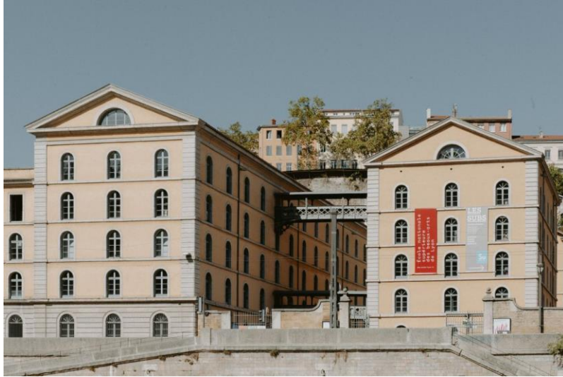
Ensba Lyon – Photographie Blandine Soulage

École nationale supérieure des beaux-arts de Lyon