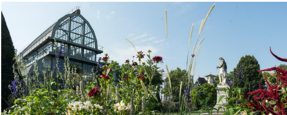
Aperçu des Grandes Serres, monument emblématique du Parc de la Tête d'Or