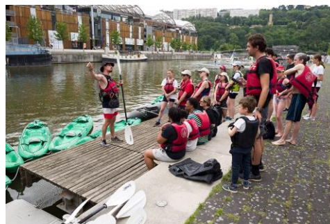
Initiation au Kayak sur la Saône

Depuis 2022, la Ville de Lyon propose le Festival entre Rhône et Saône , un événement festif, familial et participatif, pour célébrer, découvrir et protéger nos cours d'eau.