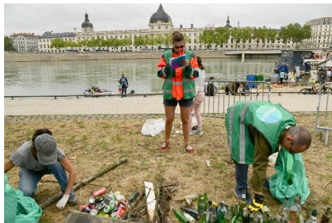
Actions de sensibilisation à la dépollution