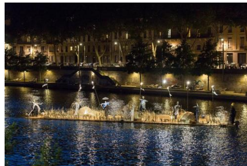
spectacle dérivant sur la Saône Création par la compagnie Ilotopie