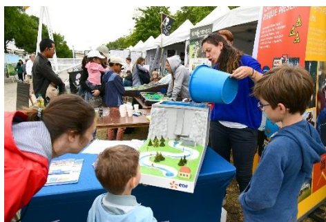
Animations au sein des Guingettes (stand partenaire)