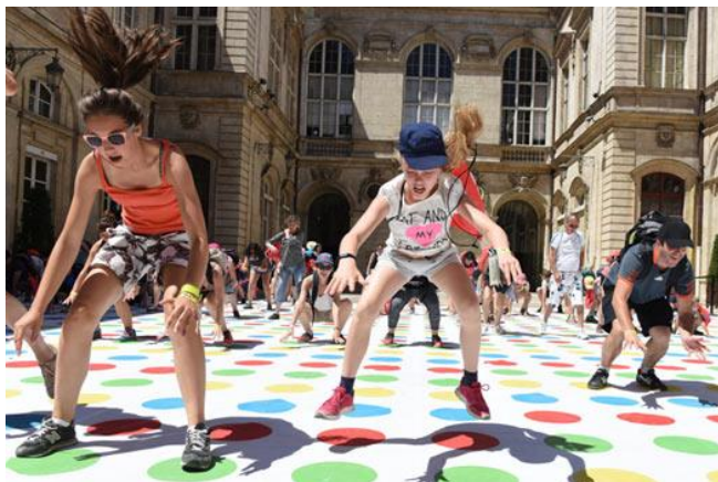
Défi sportif dans la cour de l'Hôtel de Ville !