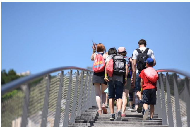
La journée est l'occasion d'une randonnée ludique en famille

RE LYON NOUS est un événement gratuit et familial organisé par la Ville de Lyon, un dimanche en juin .