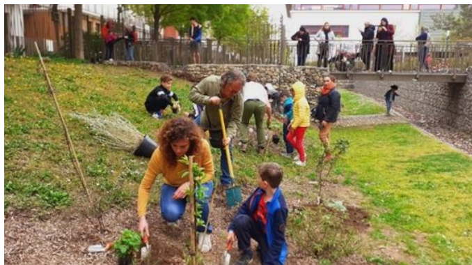
La végétalisation partout en ville permettra à tous les Lyonnais de profiter d'espaces de nature (ci-dessus un verger urbain planté et co-géré par les habitants).

Alors que les citoyennes et les citoyens plébiscitent largement la présence de végétal dans leur quotidien , la Ville de Lyon s'engage dans une nouvelle dynamique de végétalisation, avec un plan nature ambitieux.